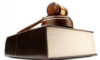
Tablo 2: Yasal Yükümlülükler ve Mevzuat Analizi