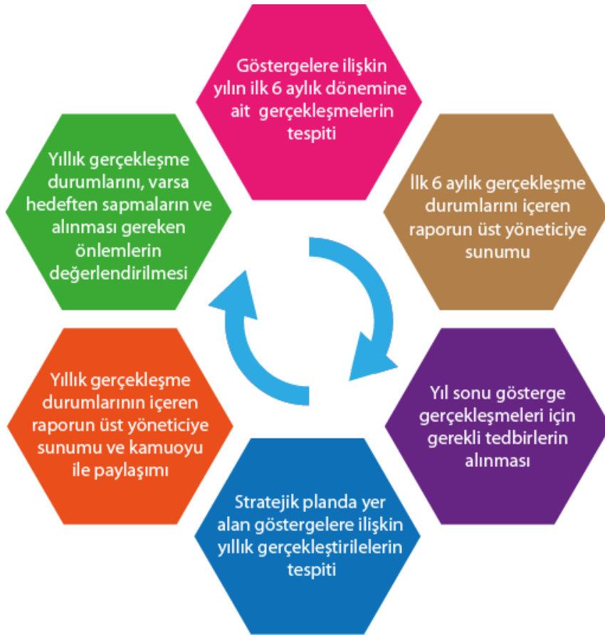
Şekil 4: İzleme ve Değerlendirme Modeli