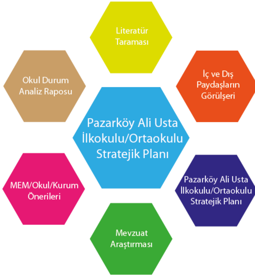
Şekil 2: Stratejik Plan Oluşum Şeması

Okulumuzun 2015-2019 Stratejik Planı, İl Milli Eğitim Müdürlüğü Ar-Ge birimi tarafından verilen stratejik plan hazırlama eğitimleri ve Milli Eğitim Bakanlığı Strateji Geliştirme Başkanlığı internet sitesi kaynaklarından yararlanılarak, durum analiz raporları, iç ve dış paydaşların görüşleri ile Milli Eğitim Müdürlüğü/Okul/Kurumların katkıları doğrultusunda hazırlanmıştır.