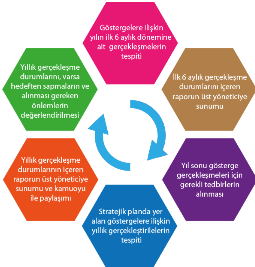
Şekil 4: İzleme ve Değerlendirme Modeli