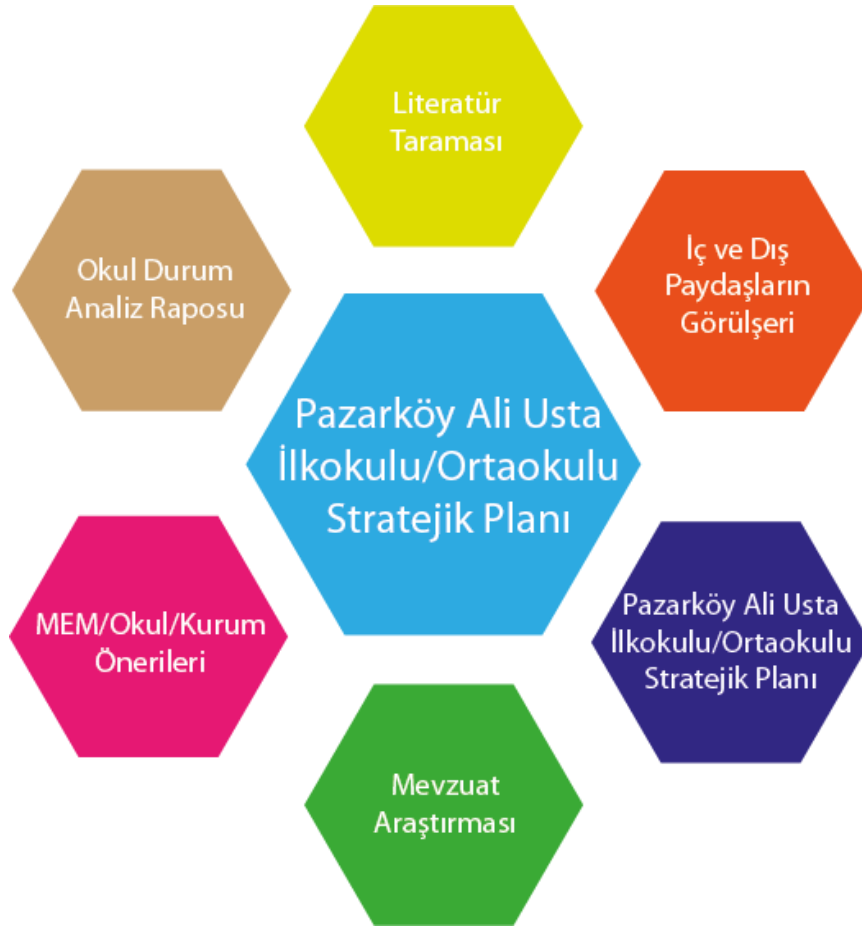
Şekil 2: Stratejik Plan Oluşum Şeması

Okulumuzun 2015-2019 Stratejik Planı, İl Milli Eğitim Müdürlüğü Ar-Ge birimi tarafından verilen stratejik plan hazırlama eğitimleri ve Milli Eğitim Bakanlığı Strateji Geliştirme Başkanlığı internet sitesi kaynaklarından yararlanılarak, durum analiz raporları, iç ve dış paydaşların görüşleri ile Milli Eğitim Müdürlüğü/Okul/Kurumların katkıları doğrultusunda hazırlanmıştır.